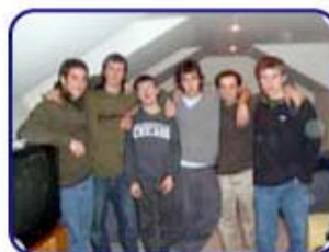
Junta de generación 2006 Colegio Tabancura

👉 Otras de las actividades que han realizado son idas al cine, a musicales y a jugar Bowling.