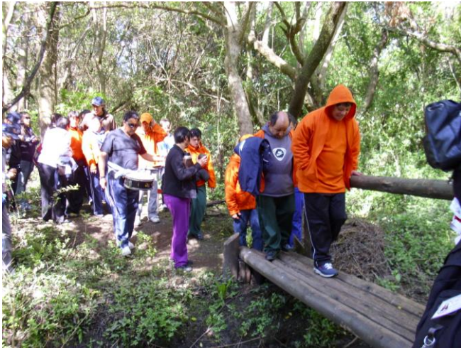
Primer desafío de los juegos Marcha aventura por el bosque