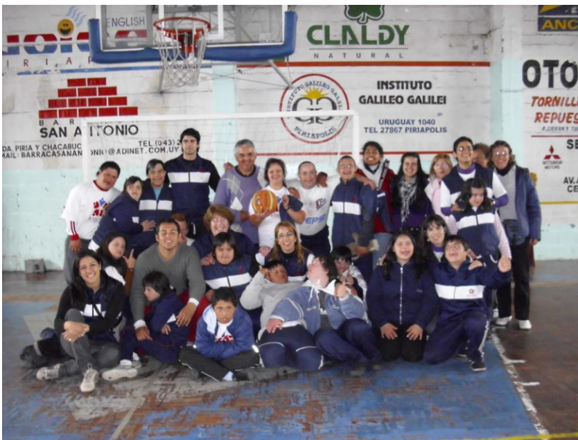
El baloncesto un juego de equipos de alta complejidad